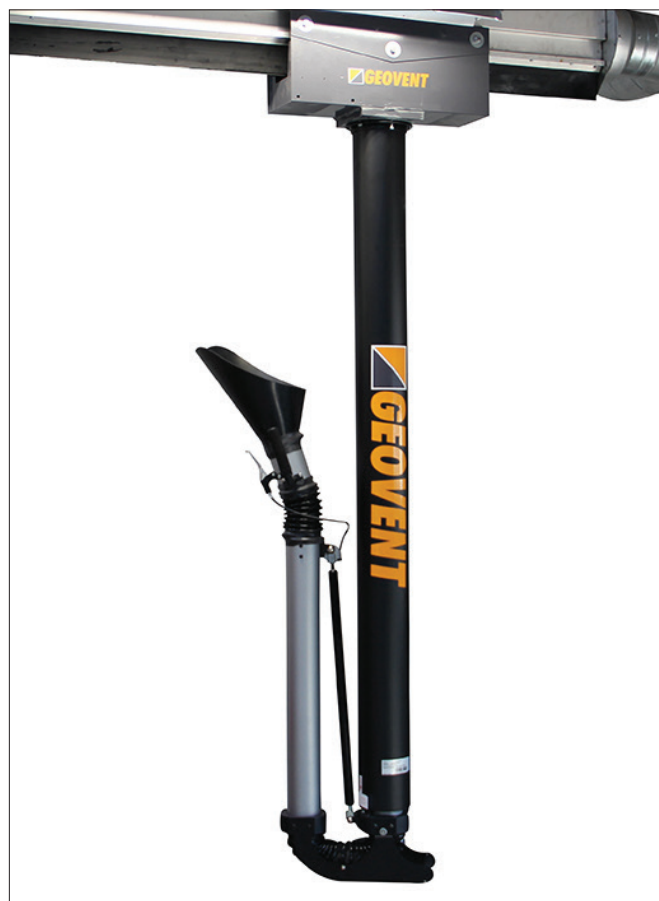
Smart Exhaust Arm