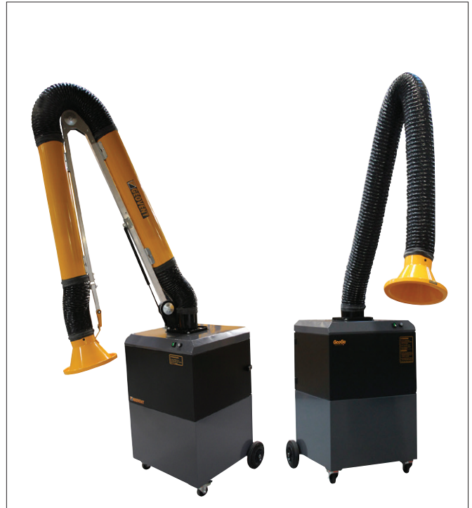
GeoGo con brazo ASA-4, brazo ESA y brazo WING