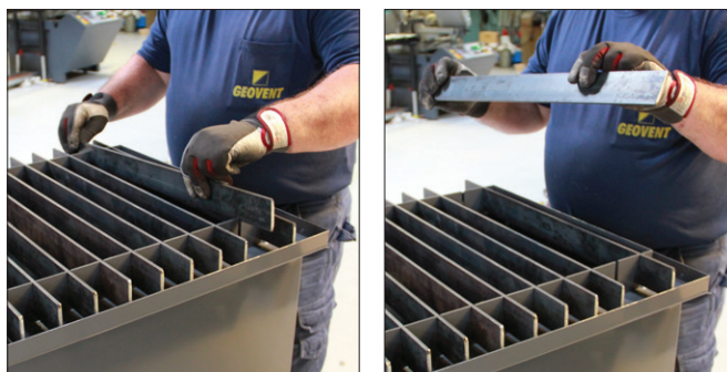
Lamellerne kan nemt flytte / skiftes hvis det ønskes.