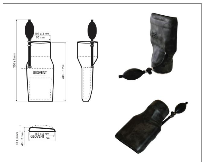
06-382 SBIA mundstyk ø100 mm 169/48