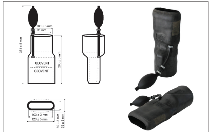
06-380 SBIM mundstyk ø100 mm oval 131/36

Mundstykket kan anvendes til andre bilmodeller, og er et standard mundstykke med håndpumpe til aktivering og ventil til deaktivering, kan leveres med trykluft aktivering med skydeventil. Mundstykket anvendes til højre og venstre udstødningsrør.