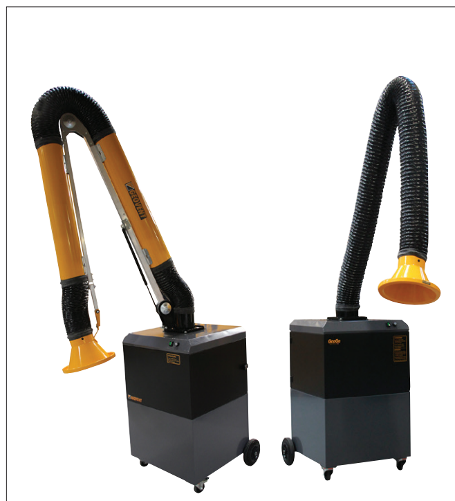
GeoGo avec bras ASA-4, bras ESA et bras WING