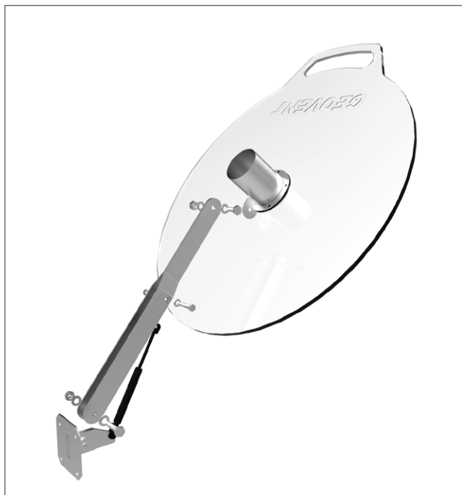
Låg i kraftig syrefast akryl