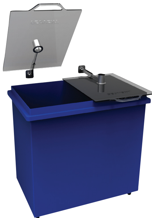
GBC arm med rektangulært låg i kraftig syrefast akryl