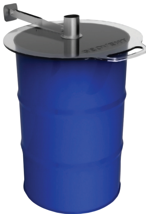
GBC arm med låg i kraftig syrefast akryl