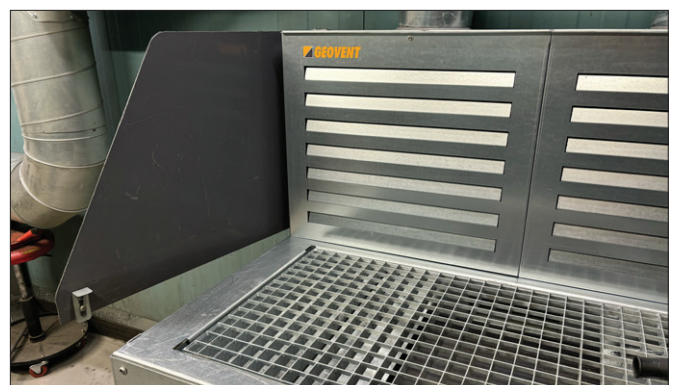
GT Ultra Schweiß- und Schleiftisch mit schwenkbarer Seitenwand