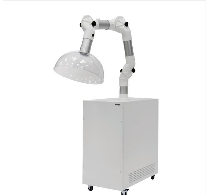
GeoGo Mini - White line

Som et supplement kan det være en effektiv løsning, at skabe udsugning af luft tæt på patienten samt generel rensning og udskiftning af luften i lokalet. Udsugning vil reducere antallet af farlige partikler, som klienter og medarbejdere udsættes for.