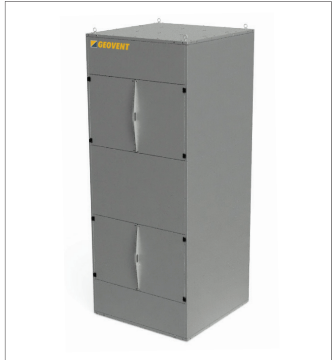
GeoFilter GFC2 2-12

Weitere Informationen zur Montage, den Installationsanforderungen usw. finden Sie in unserer Betriebsanleitung.