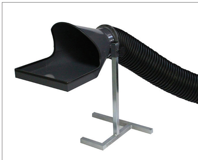
AU2 Tragten er som standard grå

\varnothing 200 mm kan aftage 1000 - 2000 m 3 /t.