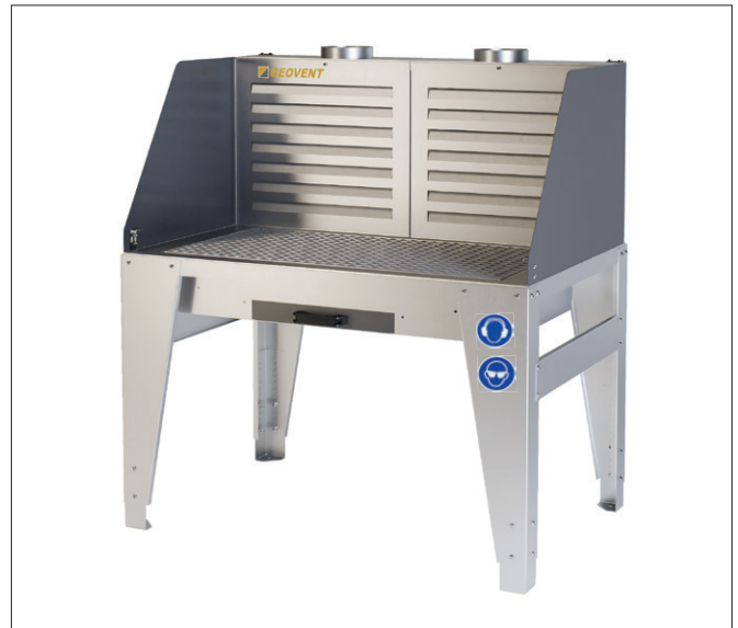
02-015 GT Ultra Mesa de soldadura y amolado con rejillas y cajón

El caudal de aire necesario para las Ref. Ref. 02-016 y 02-017: 1.500 m 3 /h. El caudal de aire necesario para la Ref. Nº 02-018: 1.600 m 3 /h.