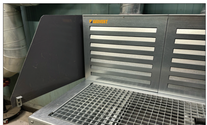
GT Ultra Mesa de soldadura y amolado con panel lateral giratorio