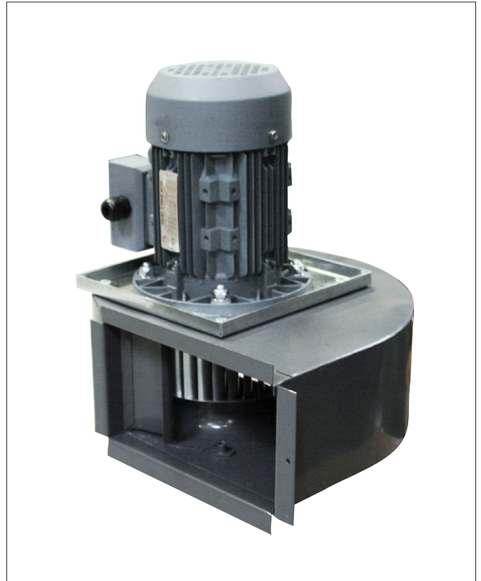
MSQ-200 ventilator - Effektiv spot udvinding