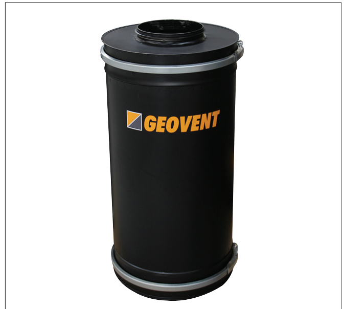
GeoFilter GF 315