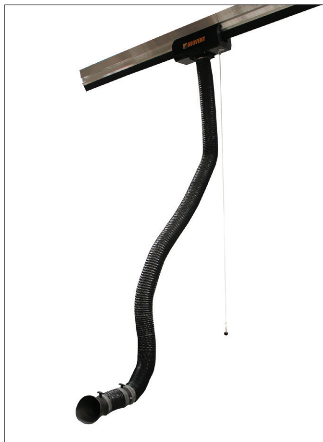
Brazo de escape CERA