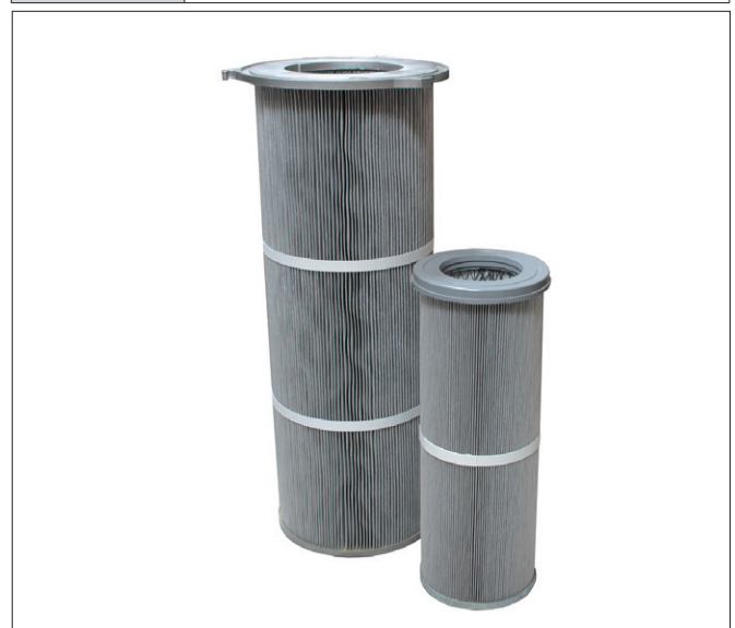
Filterpatroner for filtercyklon