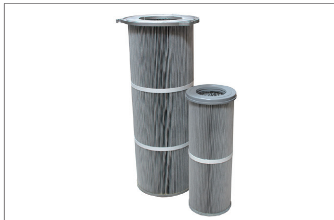
Filterpatroner for filtercyklon