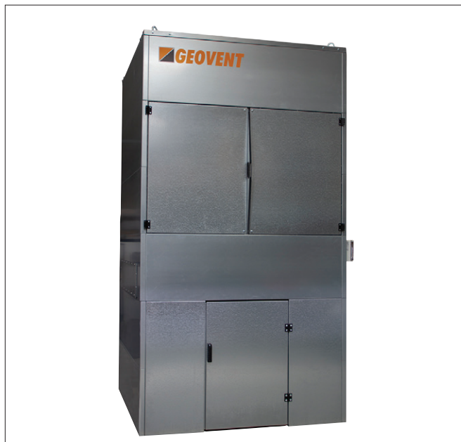
GeoFilter GFH-12 PLUS

Filterpatronerne kan leveres i en lang række varianter afhængig af behovet i den specifikke situation.