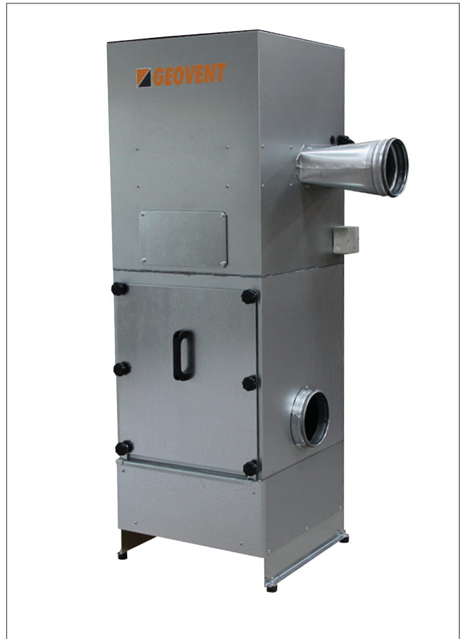
Boîte à poussière avec ventilateur et nettoyage manuel à l'air comprimé.

15-104: Nettoyage manuel à l'air comprimé. Nettoyage efficace par air comprimé avec un seul bouton poussoir.