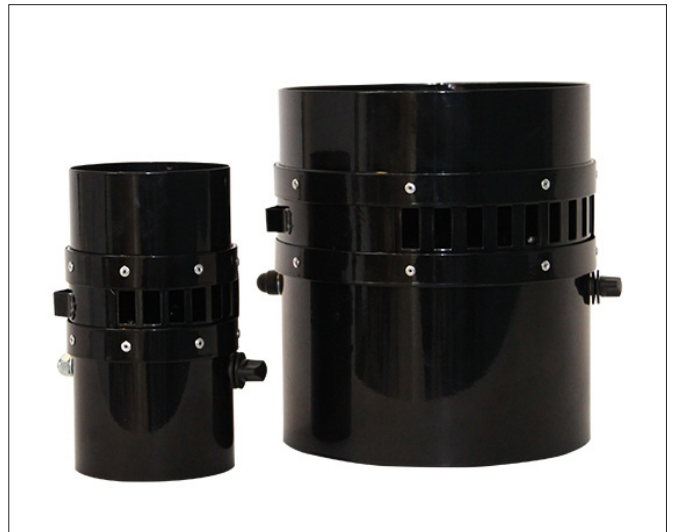
Smart Cool SC